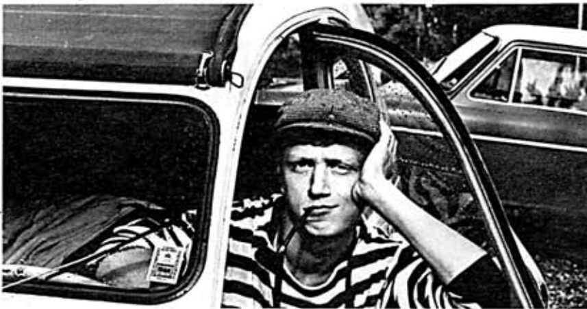
Första Leican & första bilen. Då var det -66.