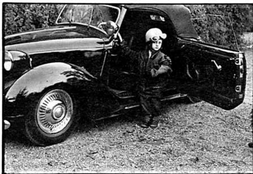
– Ung äventyrare med blank Bugatti, minns han.